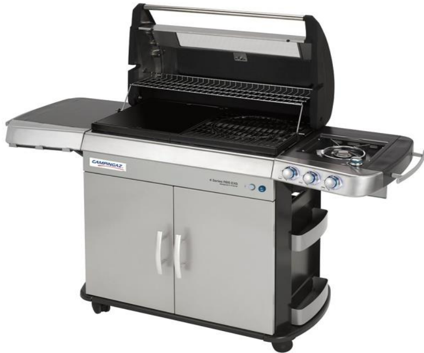
4 SERIES RBS EXS