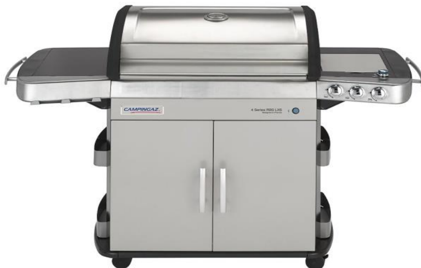
4 SERIES RBS LXS 4 SERIES ESTATE RBS LXS