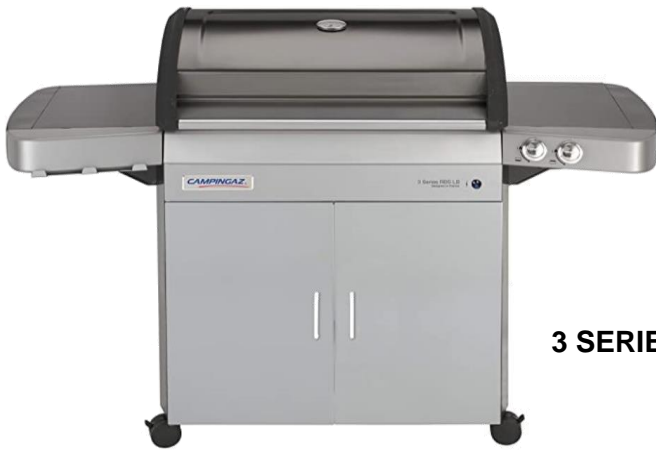
3 SERIES RBS LB