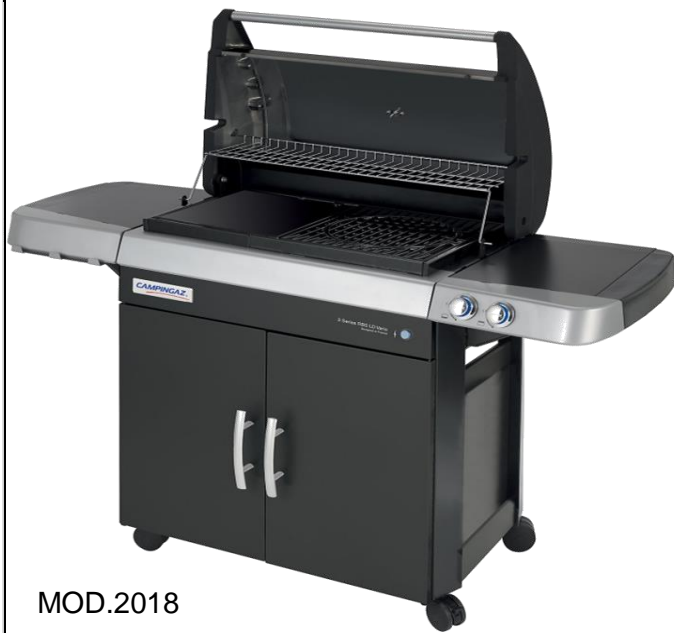
MOD.2018 3 SERIES RBS LD VARIO CLASS 3 RBS LD