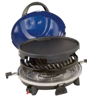
3 in 1 Grill

Des appareils idéaux pour tous ceux qui voyagent. Ces derniers garantissent une grande variété de menus et se laissent facilement transformer de réchaud en gril.