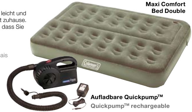
Maxi Comfort Bed Double

Nos matelas gonflables sont très robustes mais légers et ainsi idéaux pour le camping ou comme lit d'hôte à la maison. Grâce au système patenté Airtight®, vous évitez de vous retrouver par terre le lendemain.