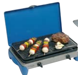
Camping Kitchen® Grill