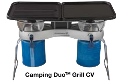
Camping Duo™ Grill CV