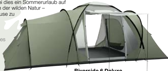
Riverside 6 Deluxe

Quelle que soit votre aventure – des vacances d'été sur le camping ou un weekend dans la nature – nous avons la tente idéale pour se sentir comme à la maison.