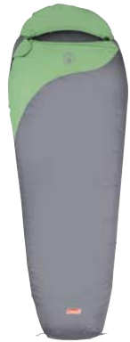
Biker 2 Season

Que vous campiez avec toute la famille, que vous soyez en excursion par des conditions extrêmes – votre sac de couchage est un des éléments les plus importants de votre équipement de camping. Peu importe le sac de couchage Coleman® que vous choisissez, il est conçu pour rendre la nuit confortable.