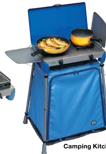
Camping Kitchen® Extra