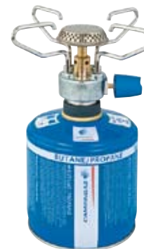
Bleuet® Micro Plus