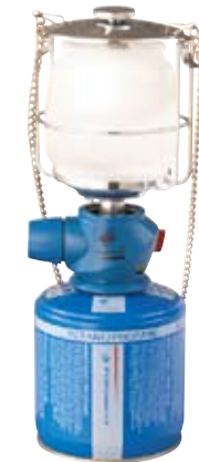
Lumostar® Plus PZ