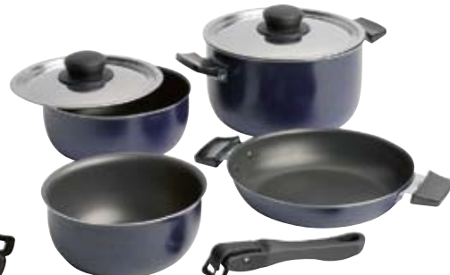
Camping-Geschirrset 8-teilig, mit Antihafbeschichtung