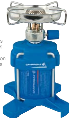
Bleuet® 206 Plus

Les appareils à cartouche perçable sont les réchauds et lampes de camping classiques, que chacun a eu, une fois ou l'autre, l'occasion d'utiliser. Ces appareils peuvent seulement être retirés une fois la cartouche étant vide.