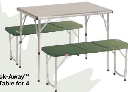
Pack-Away™ Table for 4

Transformez votre tente en un habitat grâce à notre assortiment de chaises et de tables compactes, multifonctionnelles et confortables.