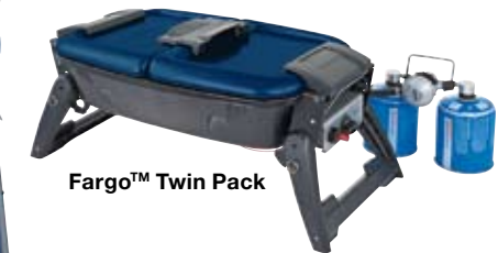
Fargo™ Twin Pack