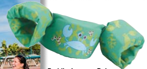
Puddle Jumpers Deluxe