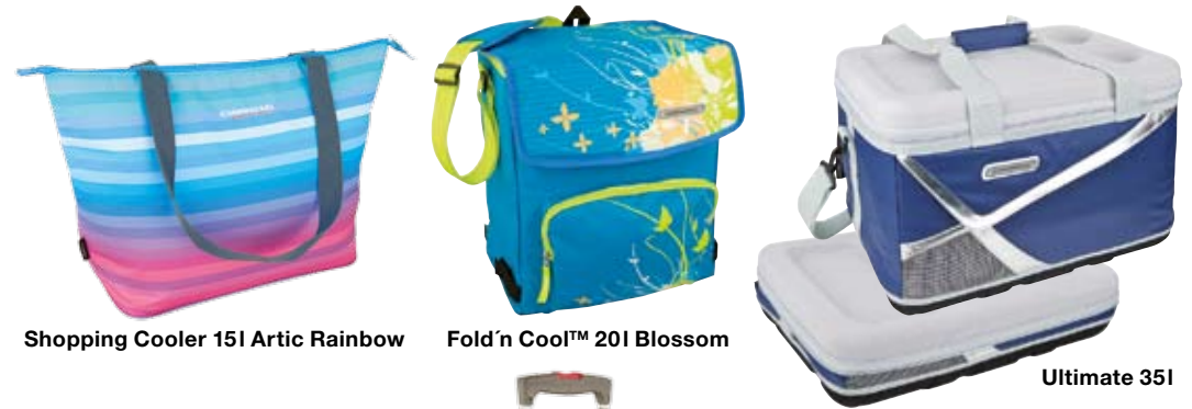
Shopping Cooler 15l Artic Rainbow

Les glacières textiles au design attractif sont très pratiques et garantissent le maintien de la fraîcheur de vos aliments.