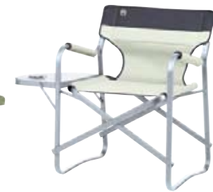
Deck Chair with Table