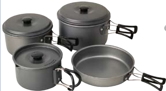
Trekking-Geschirrset 8-teilig, aus eloxiertem Aluminium

Set de vaisselle compact et léger ou grandes casseroles pour le camping – un set de casseroles fait partie de chaque équipement de camping.