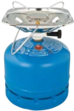
Super Carena® R