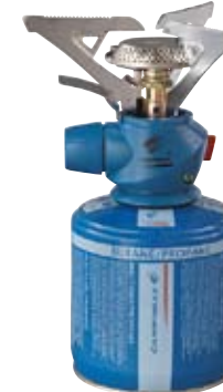
Twister® Plus PZ