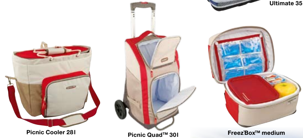
Picnic Cooler 28l