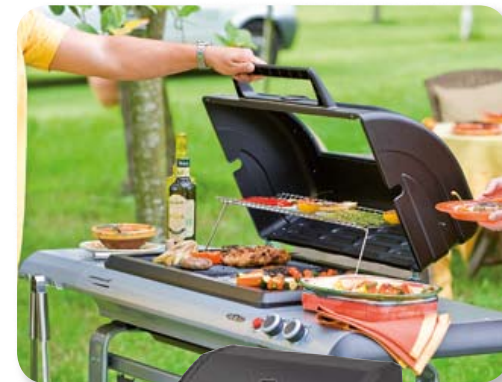
Genesco 4 Classic L Deluxe

Nos grills offrent tout ce dont vous avez besoin pour une grillade facile: allumage piézo, grande surface de cuisson, récupération des graisses facile à nettoyer, grille de mijotage et une maintenance facile. Que vous cherchiez un grill avec des brûleurs latéraux ou au style australien, avec chariot en acier ou en bois – notre assortiment vous offre toutes les possibilités. Les accessoires de grill complètent l'offre pour un meilleur confort d'emploi.