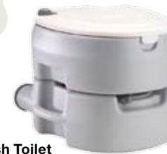
Portable Flush Toilet

Unsere Chemietoiletten sind praktisch, kompakt und leicht zu bedienen. Dazu gibt es für eine hygienische Bedienung ein umfassendes Zubehörsortiment.