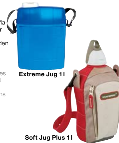
Extreme Jug 1l

Pratiques, très performantes et fiables, les gourdes sont conçues pour conserver plus longtemps les boissons fraîches ou chaudes.