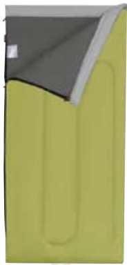
Maxi Comfort Control 220