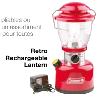
Retro Rechargeable Lantern