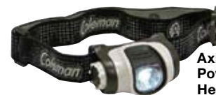
Axis High Power LED Headlamp

Rechargeables ou à batteries, pliables ou pour la tente – Coleman® offre un assortiment pratique de lampes à batteries pour toutes vos aventures en plein air.