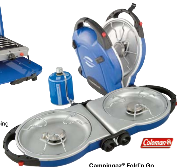
Campinggaz® Fold'n Go

Les réchauds à 2 flammes sont adaptés pour la préparation de menus complets.